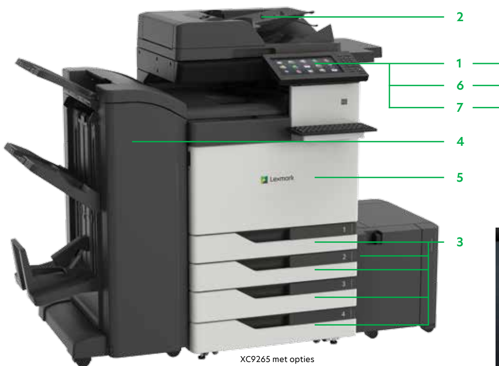
XC9265 met opties

Druk Microsoft Office-bestanden, PDF's en andere document- en afbeeldingstypen af vanaf flashstations, of selecteer documenten op netwerkservern of online stations en druk daarvandaan af.